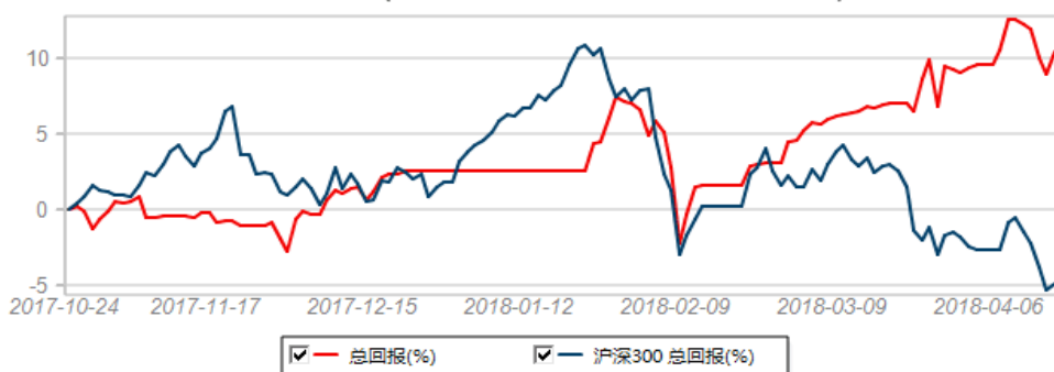
总回报(期权义务仓管理2号)